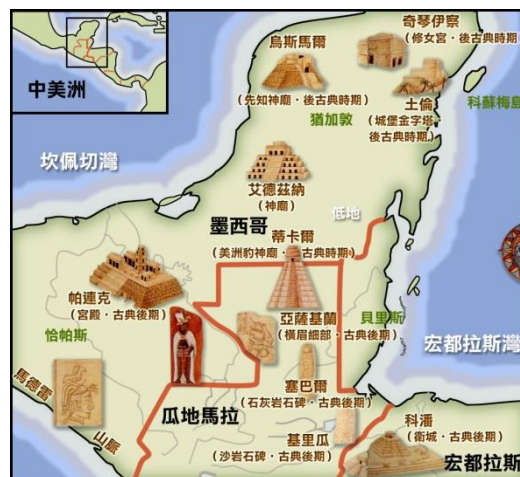
圖一、馬雅分布位置圖

此三種時期又可分為南部馬雅時期和北部馬雅時期，現今的瓜地馬拉、墨西哥的恰帕斯和宏都拉斯一帶，是南部馬雅人創造前古典與古典文明的地方，也是馬雅文明早期發展的搖籃，當時最著名的中心為蒂卡爾和科潘。等到這些中心衰落後，北部馬雅文明隨之興起，此時的馬雅人主要居住在墨西哥南部與猶加敦半島一帶，統稱為後古典時期。但南部馬雅時期才是創造出整個馬雅人中，最燦爛文明的主要時期，馬雅人不僅在農業上，培育了玉米、南瓜、可可等作物。更在藝術、天文曆法和數學演算中，有著極大的成就和相當的貢獻。