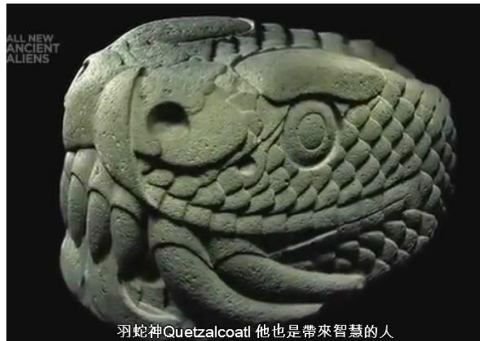
羽蛇神Quetzalcoatl 他也是帶來智慧的人

在西班牙人進入之後，馬雅族有許多古籍都被燒毀，幸好還有些保留下來，影響馬雅人最大的古籍就是《馬雅族聖經》《Popol vuh》，它是占卜之書，言及諸天之神有無上智慧，有洞悉世上每件事的法力，祂們知道何時有兵災、死亡以及饑荒，甚至對於現今時勢、將來人類前途都有論述；讓後人經由神學的解讀過程來探索千萬年前所發生的重大事故。這些天機用密碼暗藏在建築物、雕刻、繪畫、珠寶及他們發明的數學系統等多種管道，保存並傳到後人手中。